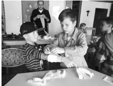
Erste Hilfe-Kurs evang. Kirchengemeinde