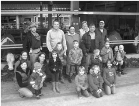
„Die schlaunen Külmitzfüchse“ des Obst- und Gartenbauvereins Spiesberg in Wunkendorf