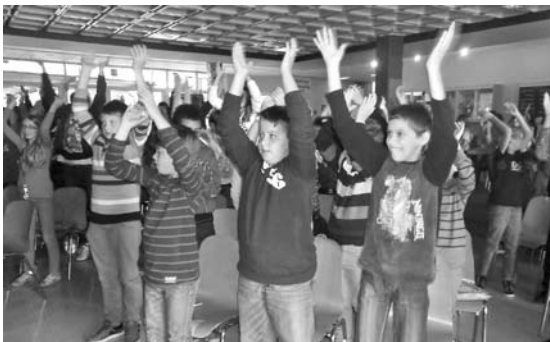
Drogen- und Suchtprävention in unserer Mittelschule