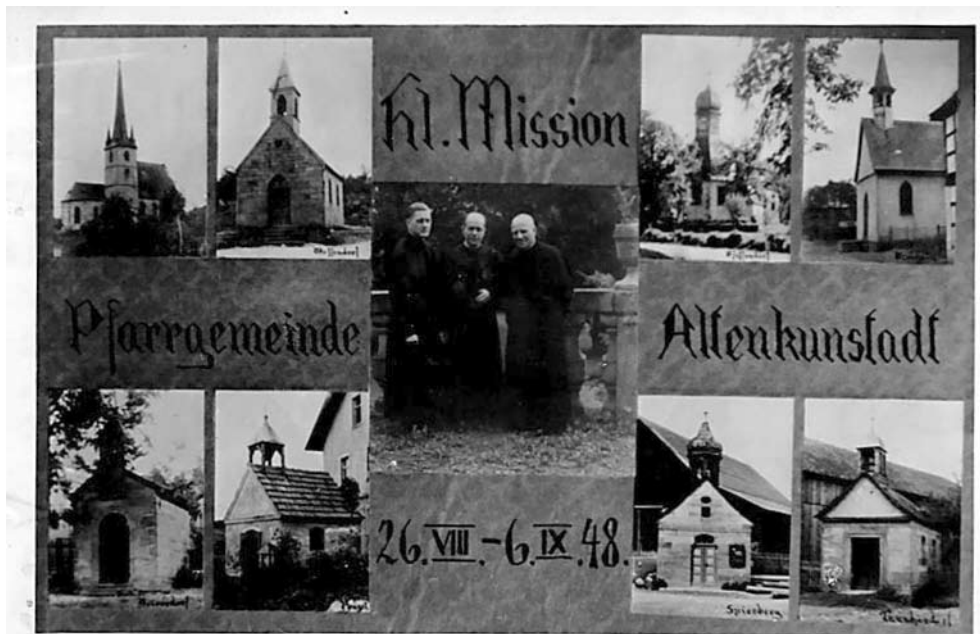
Pfarrgemeinde Altenkunstadt Hl. Mission 26. August bis 06. September 1948