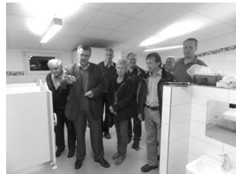
Besichtigung der neuen Toilettenanlage in der Kathi-Baur-Kita