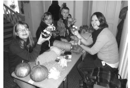
Pfarrfest kath. Kirchengemeinde