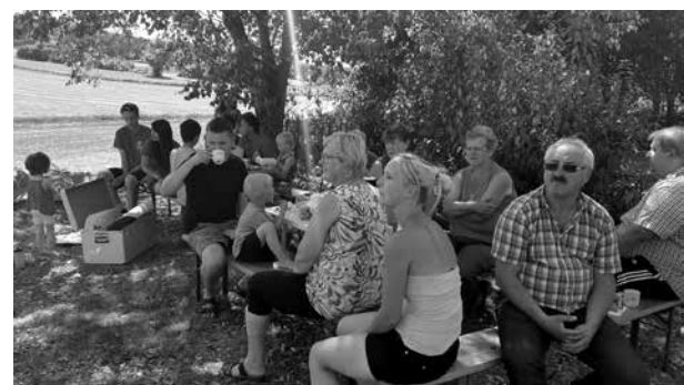
Spielemobil in Maineck