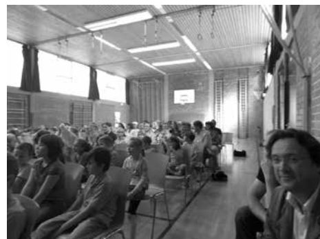
Verabschiedung der 4. Klassen der Grundschule