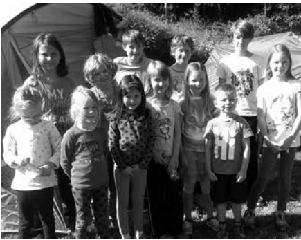
Die Jugendgruppe „Die schlaun Kilmitzfüchse“ des OGV Spiesberg beim Zelten