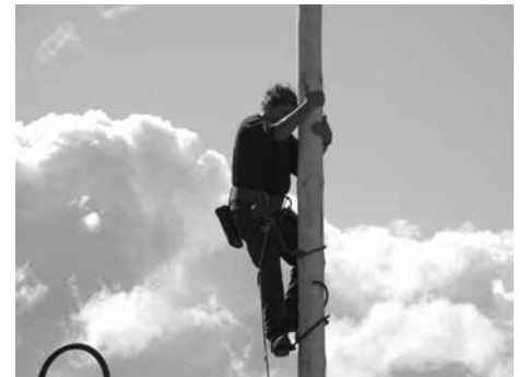
Kirchweih in Burkheim