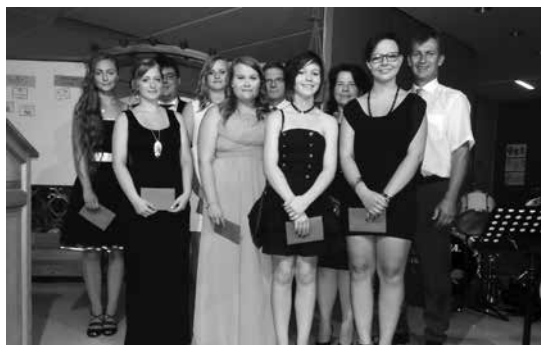
Ehrungen und Verabschiedungen an unserer Mittelschule