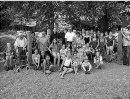
Spielgeräteeinweihung in Spiesberg