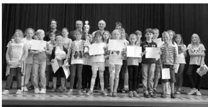
Sportliche Ehrungen an unserer Grundschule