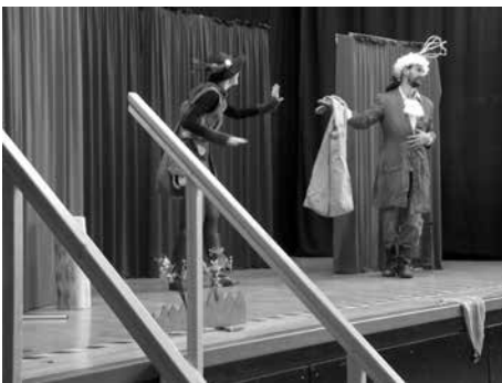
Fränkischer Theatersommer in der Grundschule