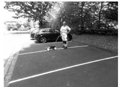
Hausmeister der Grundschule beim Aufbringen der Linien am Parkplatz