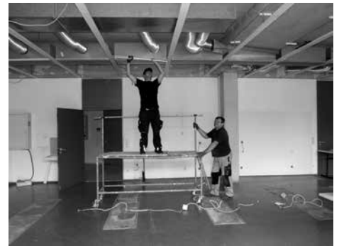
Ausbau Schulküche in der Mittelschule