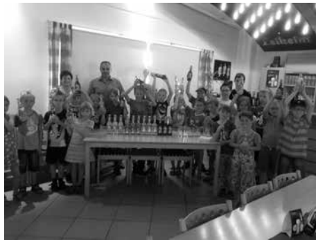
Limoprobe bei Brauerei Leikeim Jugend-Sommerferien-Programm