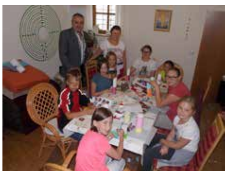
Kreativ Kerzen verzieren