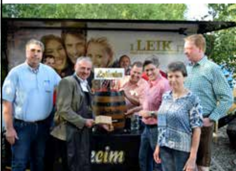
Bieranstich Dorffest Strössendorf