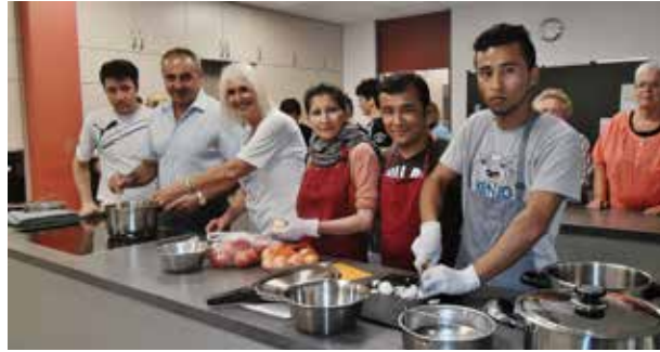
Kochen für die Helfer