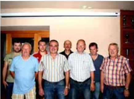
Neuwahlen beim 1. FC Altenkunstadt/Woffendorf