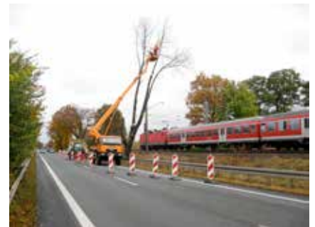
Professionelle Dienstleister übernehmen Baumfällarbeiten an Freileitungen und Bahntrassen.

Grundsätzlich gilt: Nur Profis sollen sich mit diesen Arbeiten auseinandersetzen. Sie wissen die Gefahr richtig einzuschätzen und können ihr bereits im Vorfeld entsprechend entgegen treten. Lebensgefahr besteht unter anderem, wenn der Sicherheitsabstand beim Freischneiden von Trassen nicht mehr eingehalten wird, weil Äste und Baumkronen zu nah an die Leitungen herangewachsen sind. Vor allem Nebel oder Regen kann zu einem Lichtbogenübertritt führen, der einem Berühren der Leitung gleichkommen kann. Berührt ein Baum eine spannungsführende Leitung, kommt es zu einem sogenannten „Erdkurzschluss“ und dadurch zu einem lebensgefährlichen Spannungstrichter im Radius von mindestens 20 Metern.