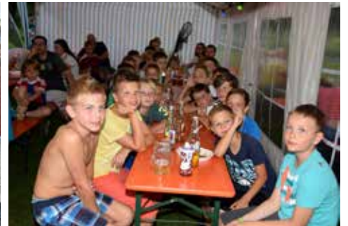
Saisonabschlussfeier Fußballjugend 1. FC Altenkunstadt/Woffendorf