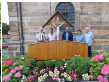
Schwesterngrab erstrahlt in neuem Glanz