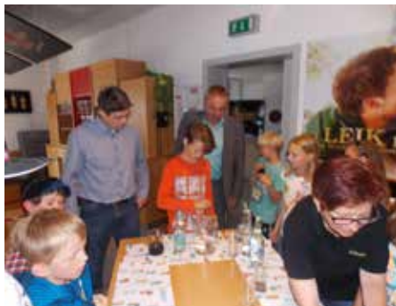
Limoprobe Familienbrauhaus Leikeim