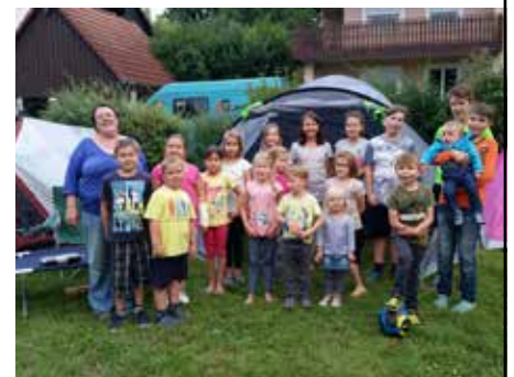
Zeltlager Külmitzfüchse Spiesberg