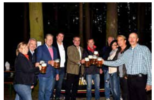
Waldfestauftakt in Woffendorf