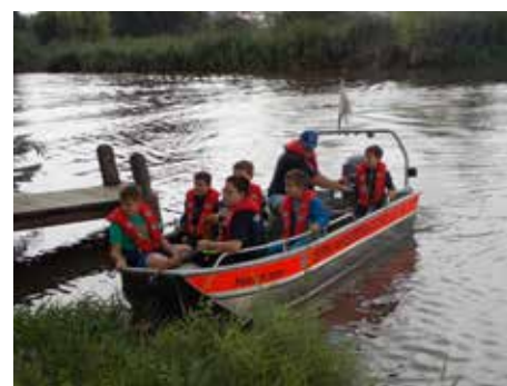
Boot fahren mit der Wasserwacht