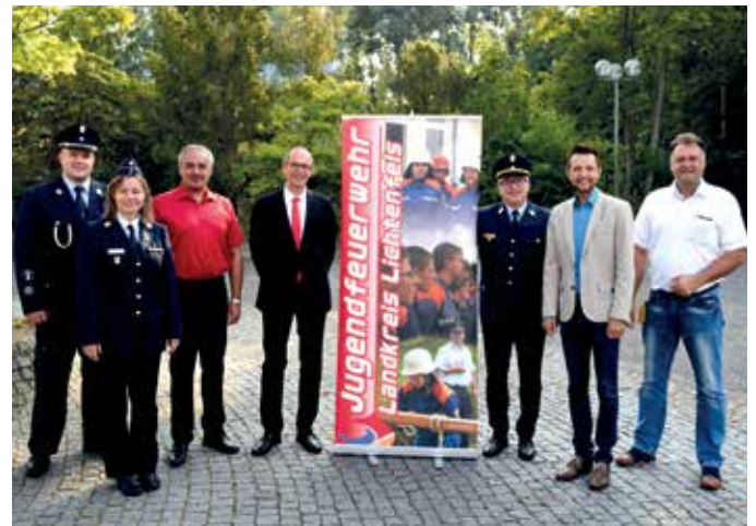
Kreisjugendfeuerwehrtag in Altenkunstadt

Die beiden Mannschaften werden am Bezirksjugendleistungsmarsch im Oktober in Pressig teilnehmen. Mein herzlicher Dank gilt den Mitgliedern der Freiwilligen Feuerwehr Altenkunstadt, die den Kreisjugendfeuerwehrtag mit ihren vielen Helferinnen und Helfern hervorragend organisiert und ausgerichtet haben.