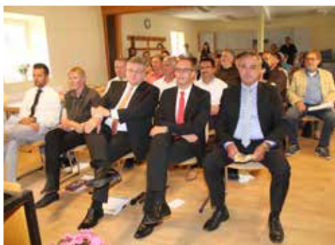
Tag des offenen Denkmals Katholisches Pfarrhaus