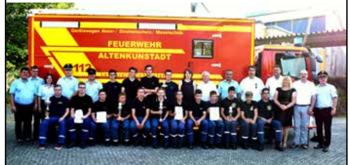
Kreisjugendfeuerwehrtag in Altenkunstadt mit den vier erstplatzierten Wehren