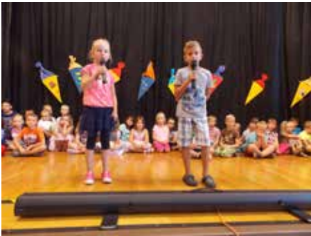
Begrüßung der Erstklässler durch die Zweitklässler