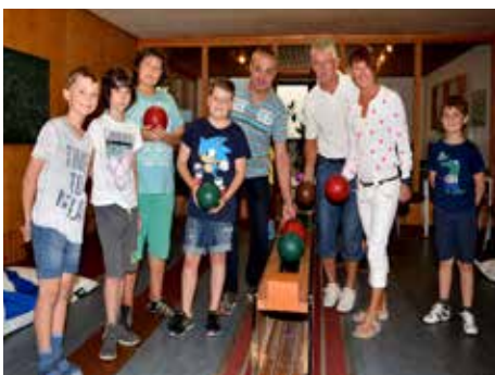
Jugend-Sommerferien-Programm: Kegelturnier mit den drei Bürgermeistern im PINS