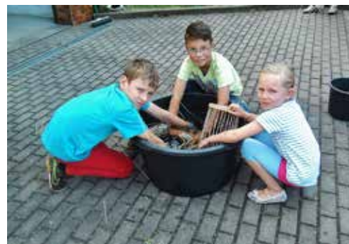
Jugend-Sommerferien-Programm: Selber ein Brotkörbchen flechten