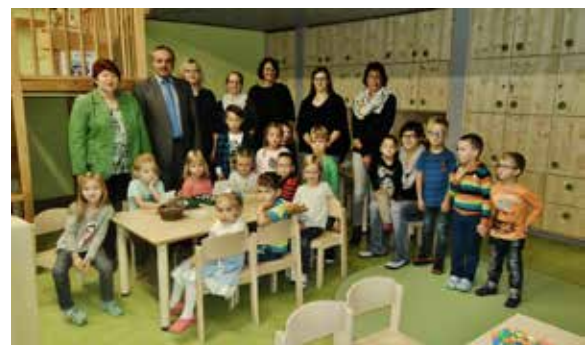
Die Mäusegruppe in der Kathi-Baur-Kindertagesstätte wurde in den Ferien grundlegend saniert. Die Gesamtkosten betragen ca. 60 000 €.