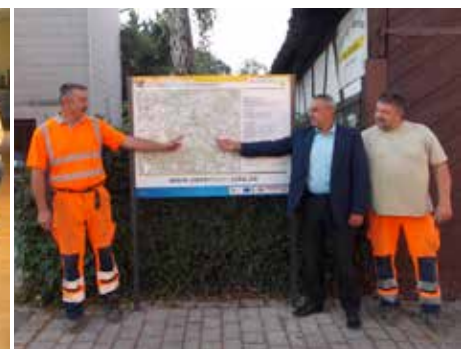
Aufstellen neuer Wandertafeln im Gemeindegebiet