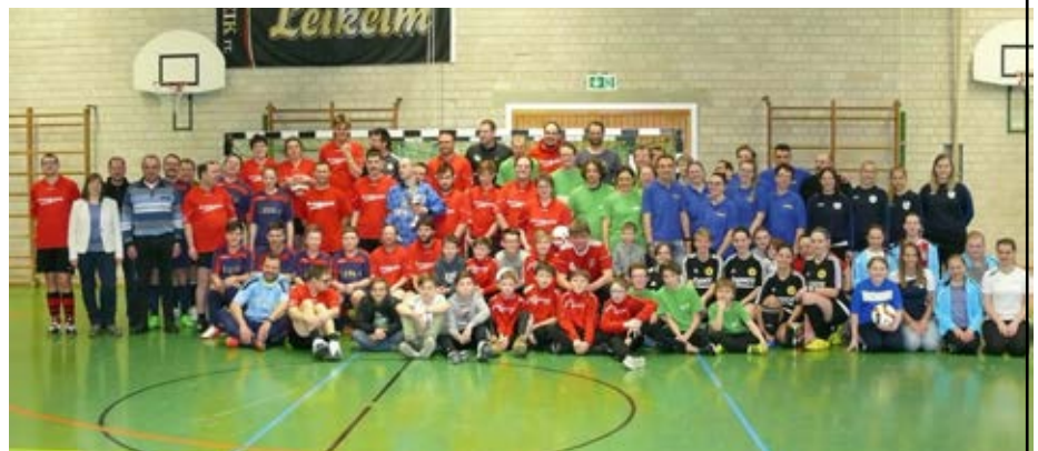
Fußballturnier Regens Wagner Burgkunstadt