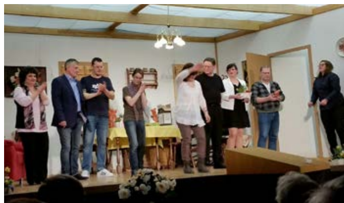
Theateraufführung RV Concordia Altenkunstadt