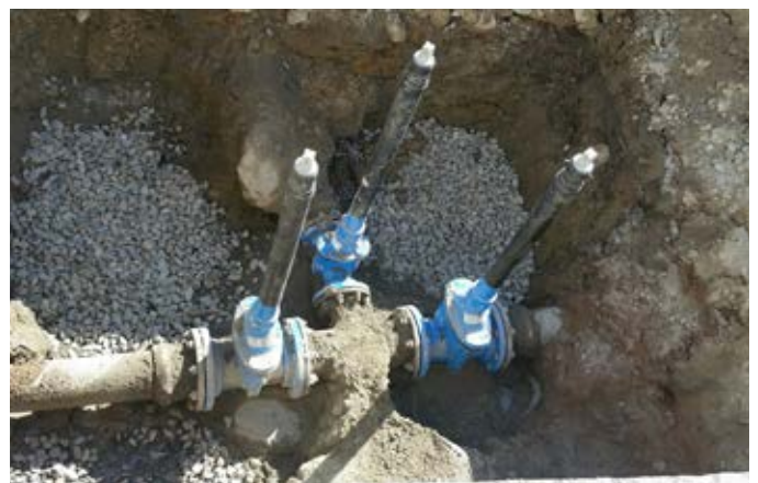
Wasserschieberwechsel in Burkheim