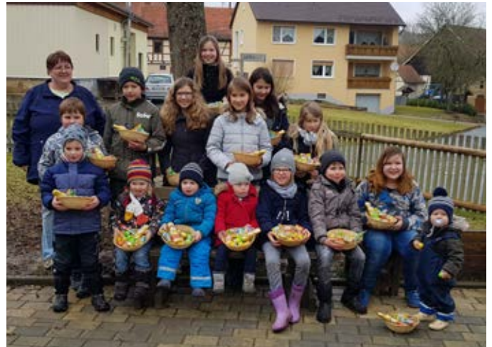
Osternestsuche Jugendgruppe Spiesberg