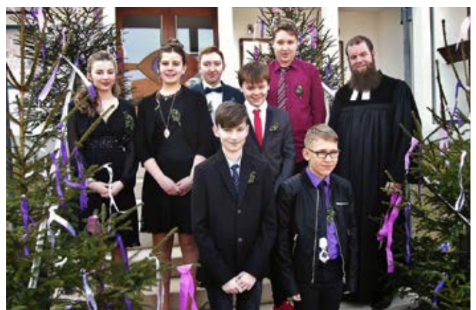
Konfirmation in Altenkunstadt