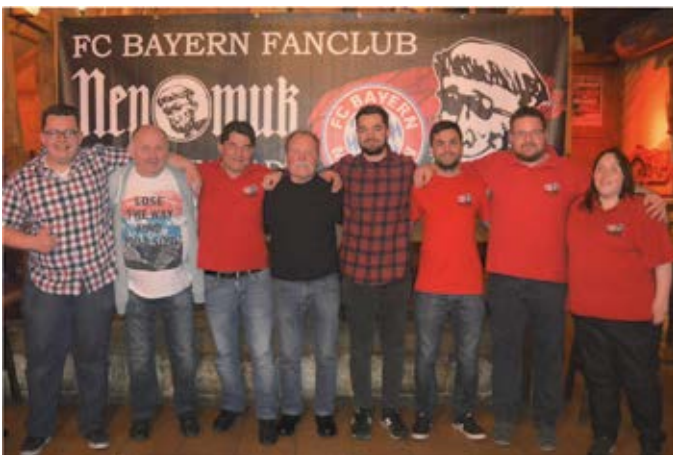
Jahreshauptversammlung FC Bayern Fanclub Nepomuk