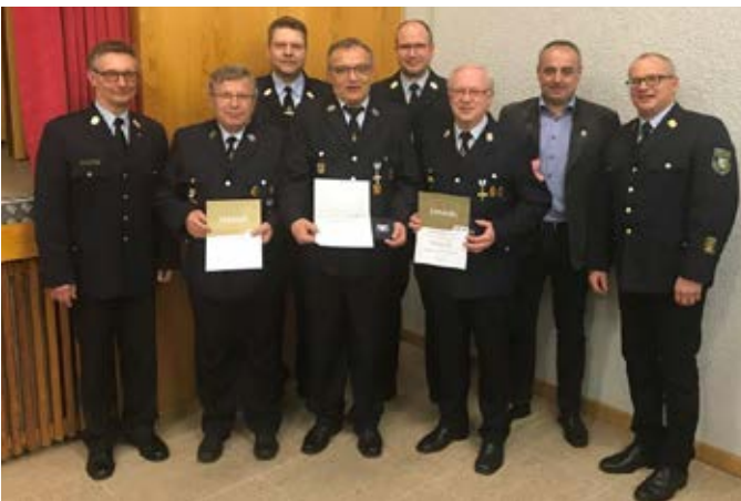
Ehrung verdienter Kameraden der FFW Altenkunstadt durch den Kreisfeuerwehr Verband Lichtenfels e. V.