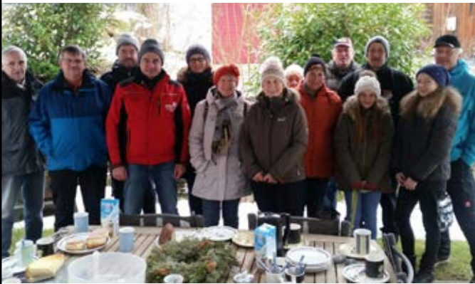
Winterwanderung 1. FC Woffendorf