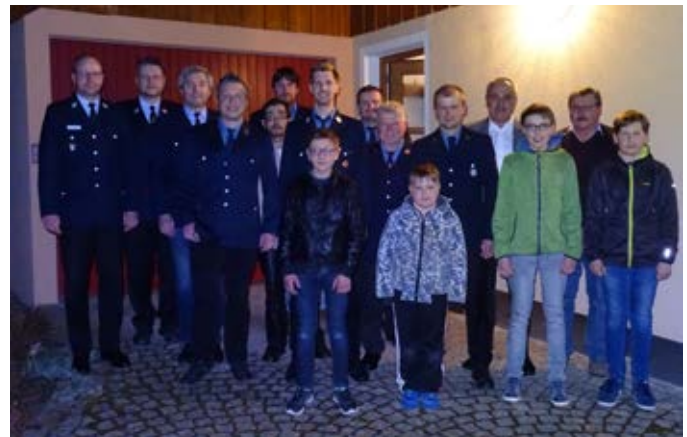
Jahreshauptversammlung mit Neuwahlen FFW Spiesberg