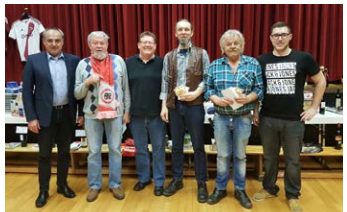
Preisschafkopf 1. FC Altenkunstadt