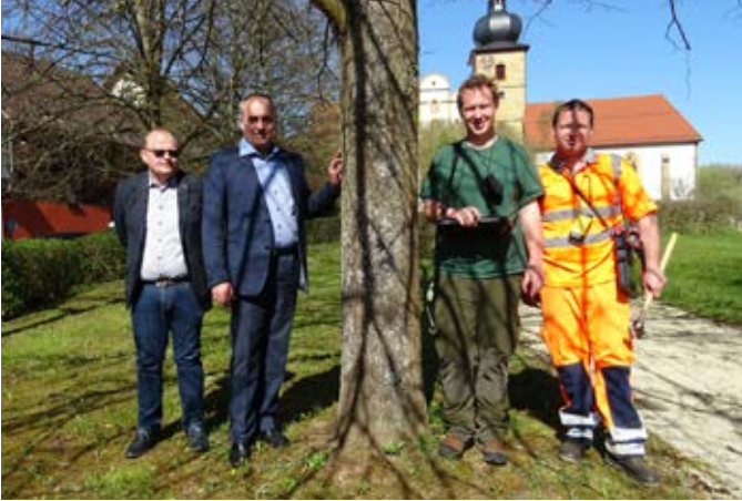
Digitale Erfassung des Baumbestands im Gemeindegebiet