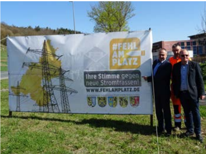
Aufstellung von Transparenten gegen neue Stromtrassen