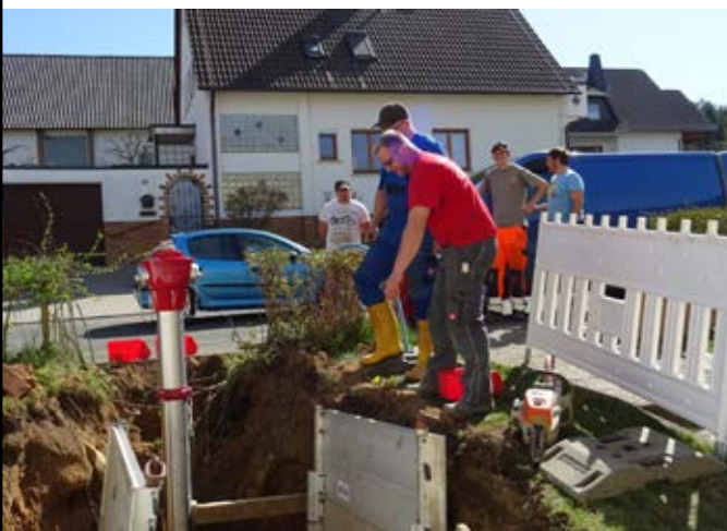
Neuer Oberflurhydrant am Galgenberg