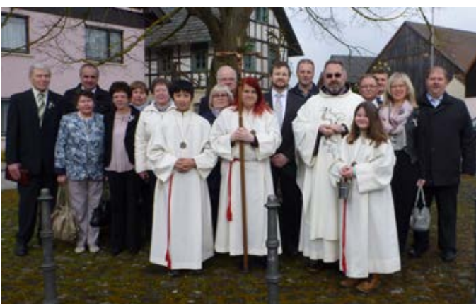
Jubelkommunion in Maineck