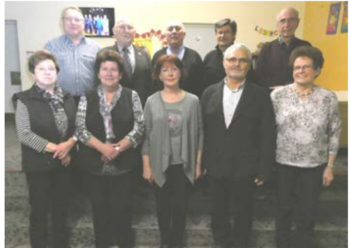
Jahreshauptversammlung mit Neuwahlen Singgemeinschaft Altenkunstadt