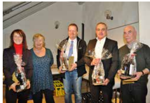
Deutsch-Französischer Abend mit Gästen aus unserer französischen Partnerstadt Quéven