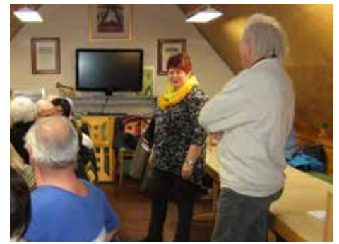
Freundschaftstreffen der Gartenbauvereine Altenkunstadt und Pfaffendorf