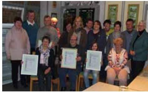
Jahreshauptversammlung mit Ehrungen