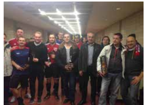
Hobbyturnier 1. FC Woffendorf