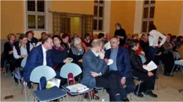
Informationsveranstaltung „In der Heimat wohnen“