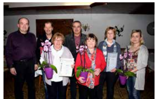
Jahreshauptversammlung Obst- und Gartenbauverein Baiersdorf