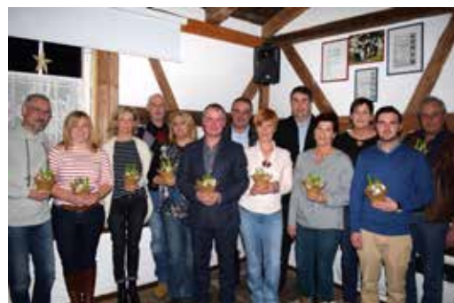
Jahreshauptversammlung Garten- und Naturfreunde Prügel