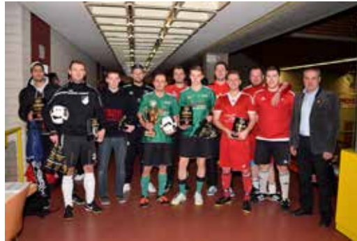
Fred Hermannsdorfer Hallenfußball-Turnier