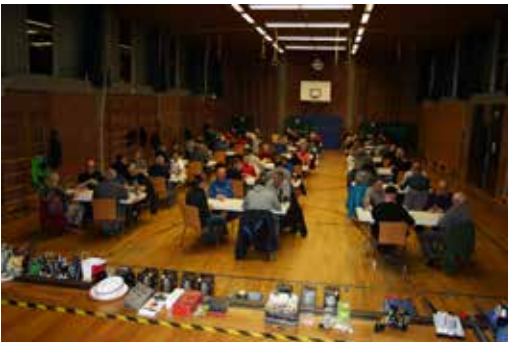
Preisbierkopf TTV 45 Altenkunstadt 1997 mit Siegerehrung