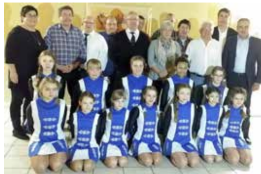
Jahreshauptversammlung mit Neuwahlen RV Viktoria Maineck