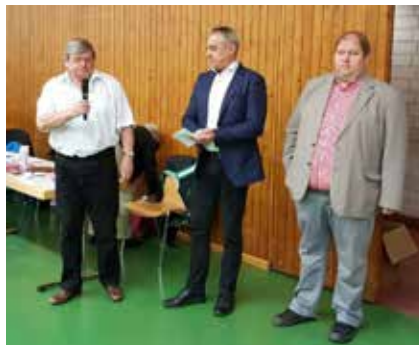
Bayerische Seniorenmeisterschaft in der Kordigasthalle TTV 45 Altenkunstadt 1997