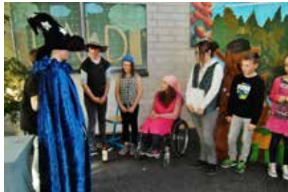
Tag der offenen Tür in der Mittelschule