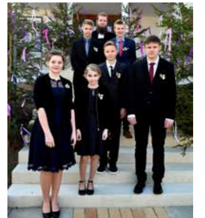
Konfirmation in Altenkunstadt