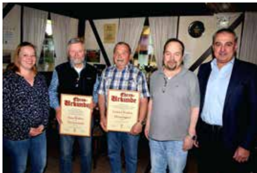
Jahreshauptversammlung mit Ehrungen TV Altenkunstadt