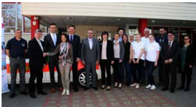
Schulschwimmen an den Grundschulen Altenkunstadt, Burgkunstadt und Weismain Aktion der DLRG und AOK