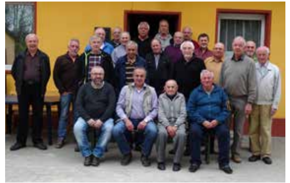
Helferessen der Feldgeschworenen, Wanderweg- pfleger, Bürgerbusfahrer und Rentnertrupp Strössendorf - allen ein herzliches Dankeschön