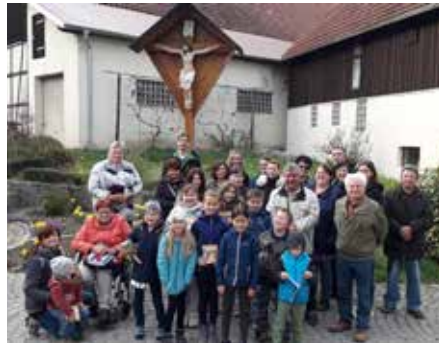
Kinderkreuzweg und Osternestsuche der Jugendgruppe des Obst- und Gartenbauvereins Spiesberg