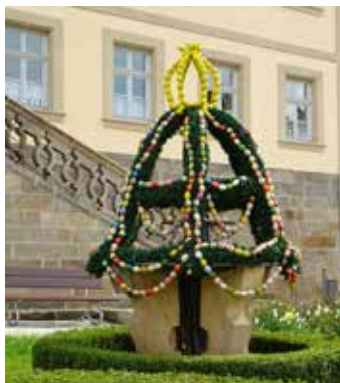
Altenkunstadt vor Kath. Pfarrhaus