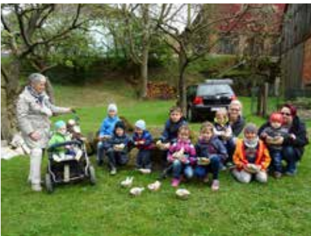
Osternestsuche beim Obst- und Gartenbauverein Woffendorf