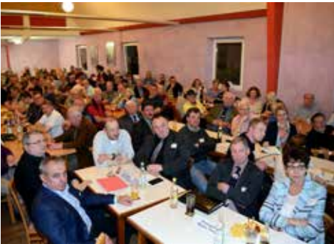
Symposium zur Vogelgrippe der Rasseflügelzüchter