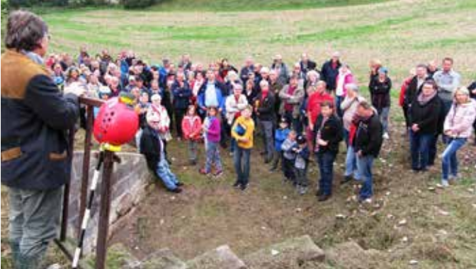
CHW Exkursion Felsenkeller in Prügel