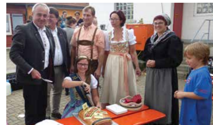
Kleine Musikersenade der Musikvereine Altenkunstadt, Weismain und Burgkunstadt