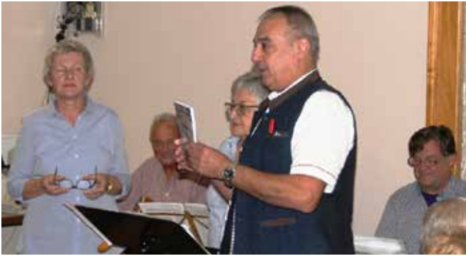
Wäddshaussinga Woffendorf, Kulturverein Altenkunstadt