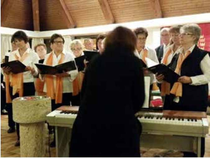
Konzert in der evang. Kreuzbergkirche zur Kirchweih