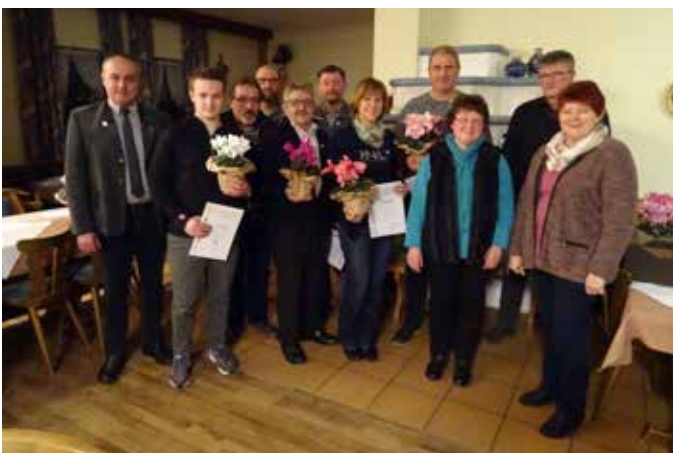
Jahreshauptversammlung mit Ehrungen Gartenbauverein Burkheim