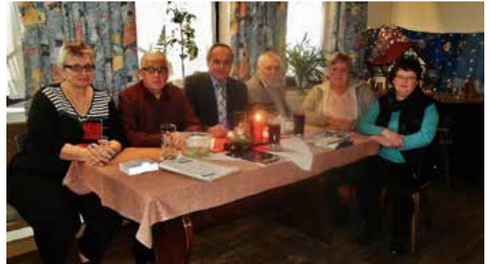
Jahreshauptversammlung mit Weihnachtsfeier VdK Burkheim