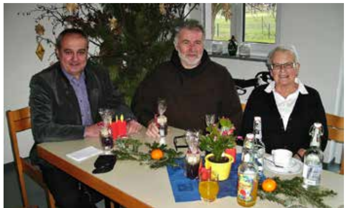
Seniorenadvent Kath. Pfarrgemeinde