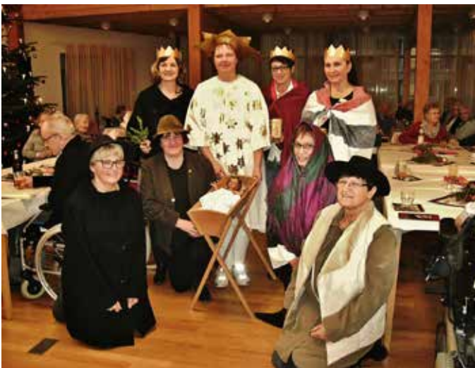
Adventsfeier im Seniorenheim