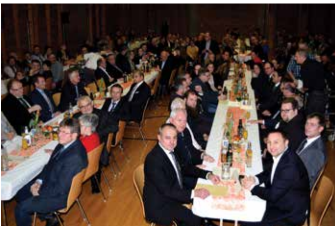
Robert Hümmer Erster Bürgermeister