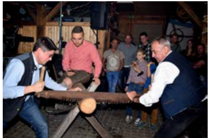
Oktoberfest 1. FC Baiersdorf