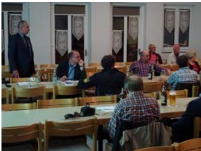
Bürgerversammlung in Altenkunstadt