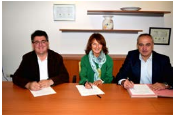
Vertragsunterzeichnung - Gemeinsamer Betrieb des Jugendtreffs PINS in Altenkunstadt - Kommunale Zusammenarbeit