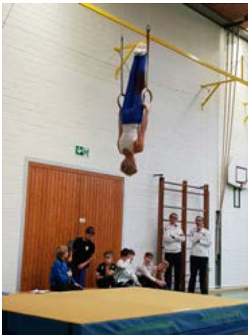
Mannschaftsmeisterschaften der oberfränkischen Turner