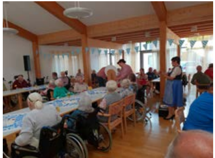
Oktoberfest Seniorenheim St. Kunigund