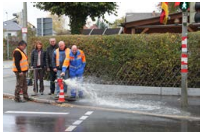
Notwasserversorgung Altenkunstadt und Burgkunstadt