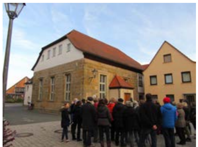
Führung durch das jüdische Altenkunstadt anlässlich des 80. Jahrestages der Reichspogromnacht mit Inge Göbel von der Interessengemeinschaft Synagoge Altenkunstadt