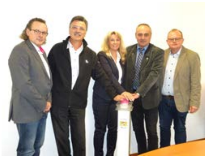
Inbetriebnahme Breitband (FTTH)

durch den aktuellen Ausbau der Deutschen Telekom können ab sofort ca. 200 Haushalte von schnellem Internet profitieren mit Bandbreiten bis zu 1 GBit/s (Gigabit pro Sekunde). Bevor diese Bandbreiten jedoch genutzt werden können, muss auch mehr Geschwindigkeit bei der Telekom gebucht werden.