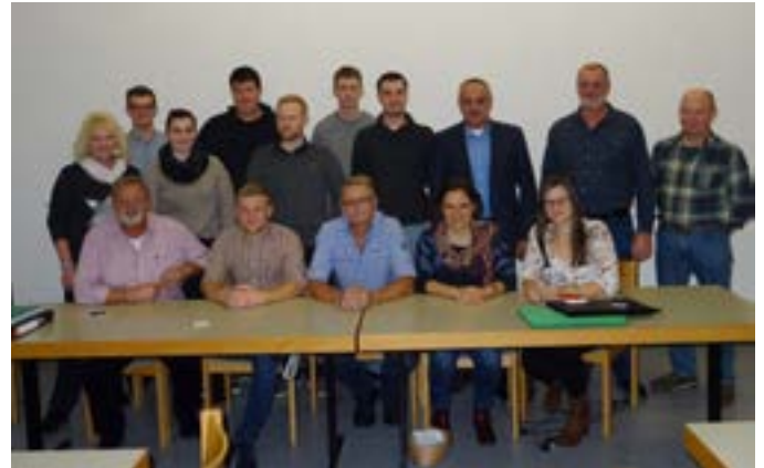
Jahreshauptversammlung mit Neuwahlen Musikverein Altenkunstadt