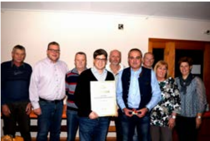
Sportheim Woffendorf - 25 Jahre ein Erfolgsmodell