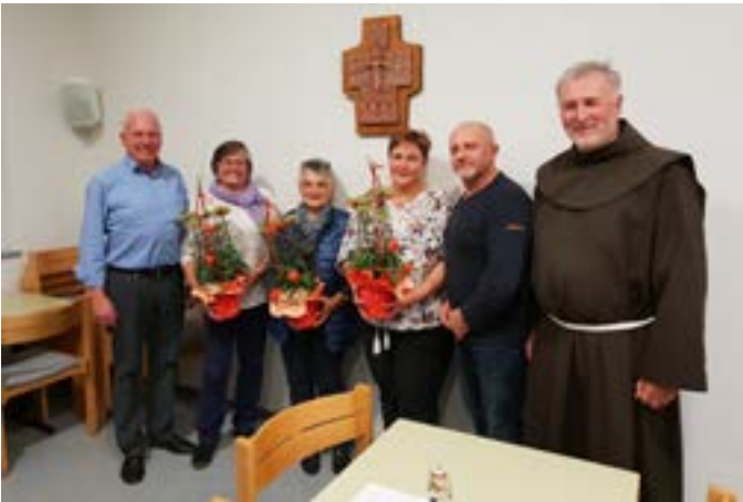
Jahreshauptversammlung Kath. Casino Altenkunstadt