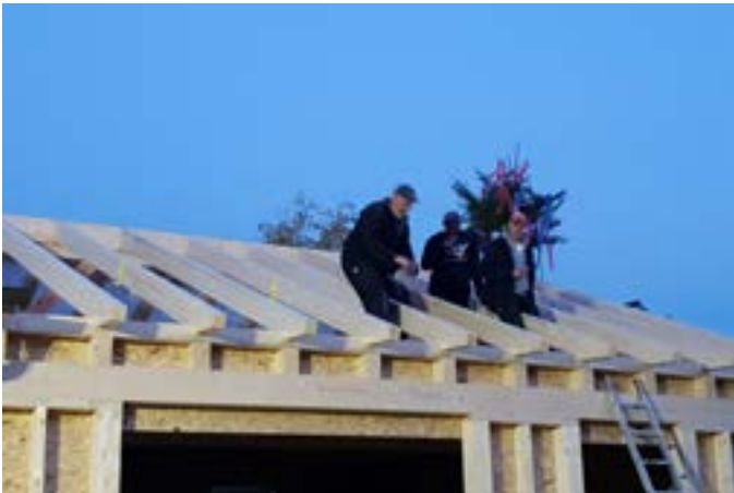
Richtfest Anbau FFW Haus Burkheim