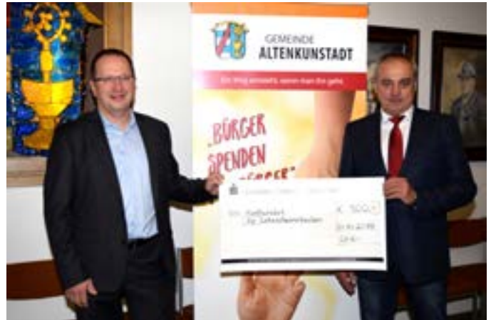
Spende für Lehrschwimmbecken der Firma Reuther NetConsulting Bad Staffelstein