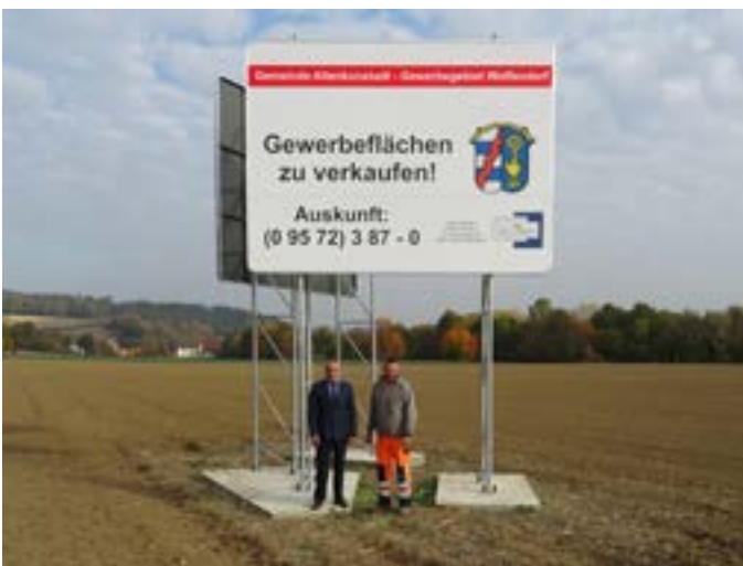
Werbung Gewerbegebiet Woffendorf