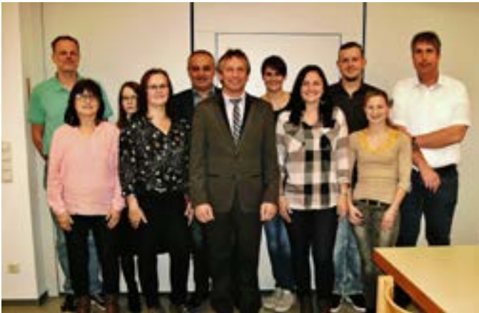
Jahreshauptversammlung mit Neuwahlen Radfahrverein Concordia Altenkunstdt