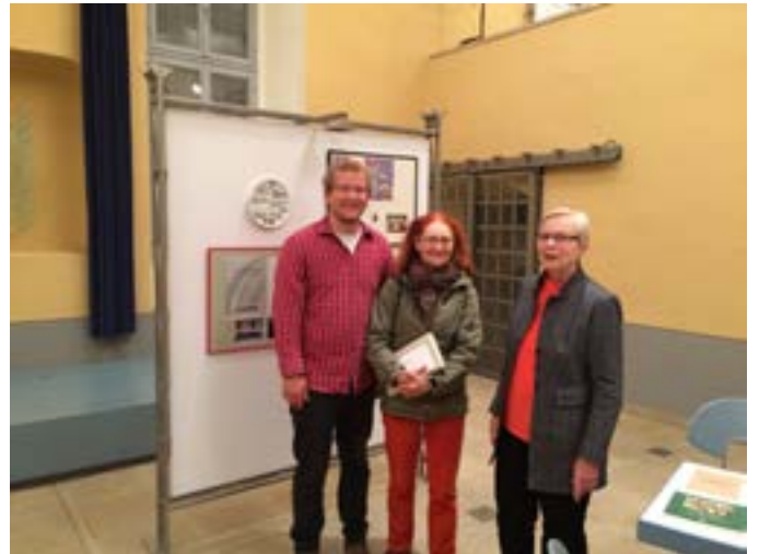
Museumsnacht in der ehemaligen Synagoge Sonderausstellung Josef Motschmann