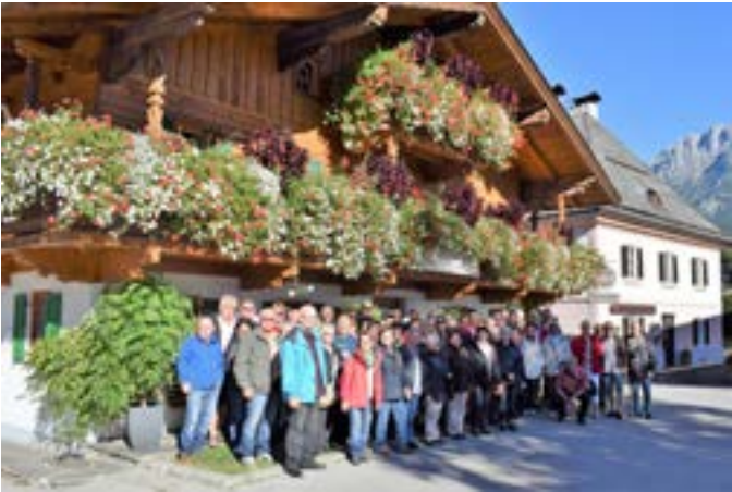
Jahresausflug des 1. FCN Fanclub nach Söll am Wilden Kaiser