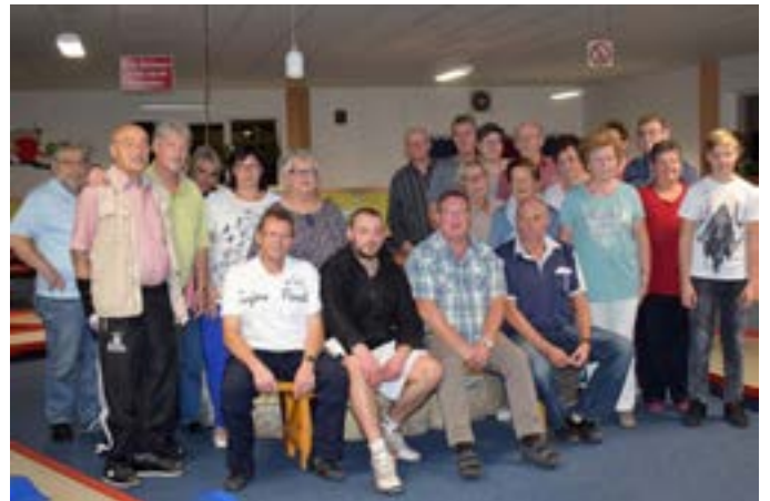
Minigolfturnier des 1. FCN Fanclub und seiner Reisefreunde