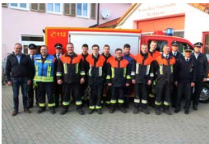
Leistungsprüfung FFW Burkheim