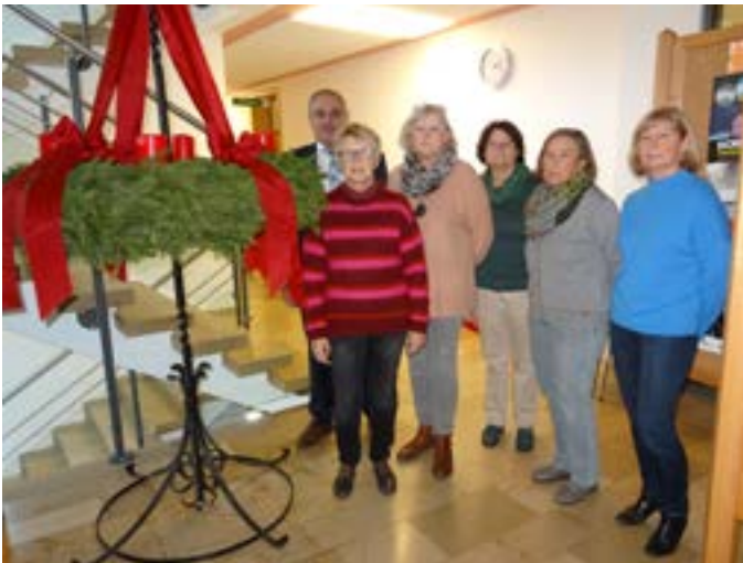
Adventskranz fürs Rathaus fertigten die Montagsbastler der evang. Kirchengemeinde