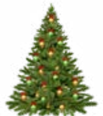
Robert Hümmer Erster Bürgermeister