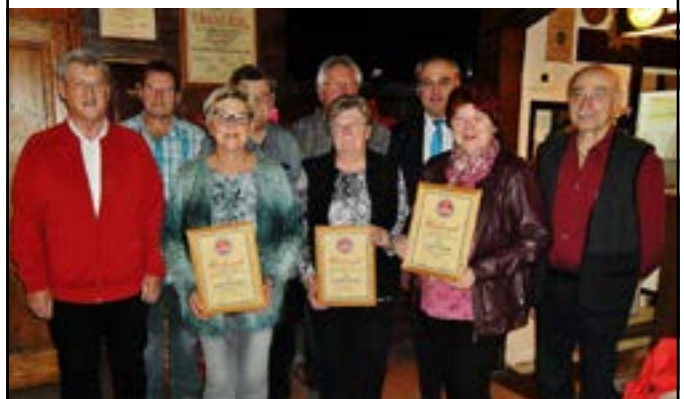
Ehrungen FCN Fanclub