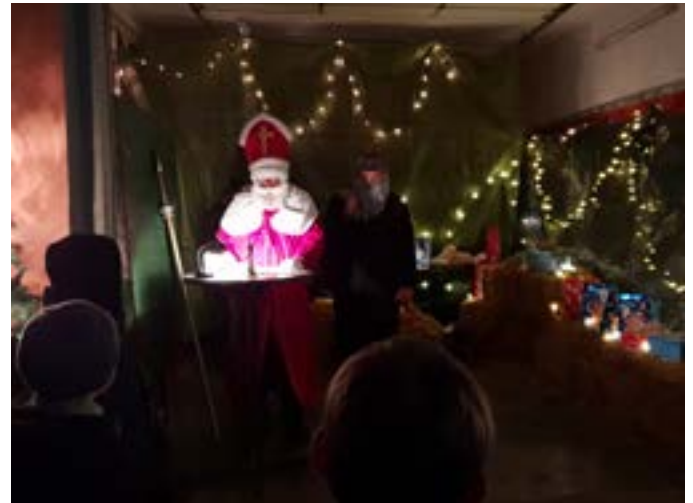
Nikolaus FFW Woffendorf