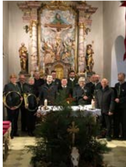
Hubertusmesse in Mainneck