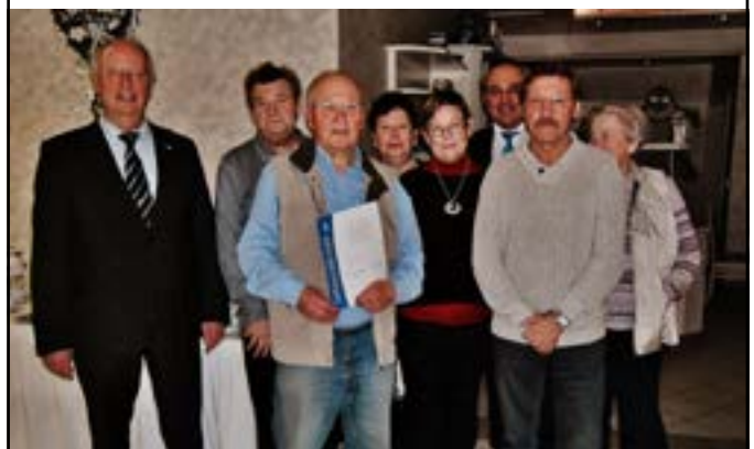
Ehrungen VdK-Ortsverband Altenkunstadt