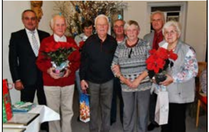
Ehrungen Gartenhobbyverein Altenkunstadt