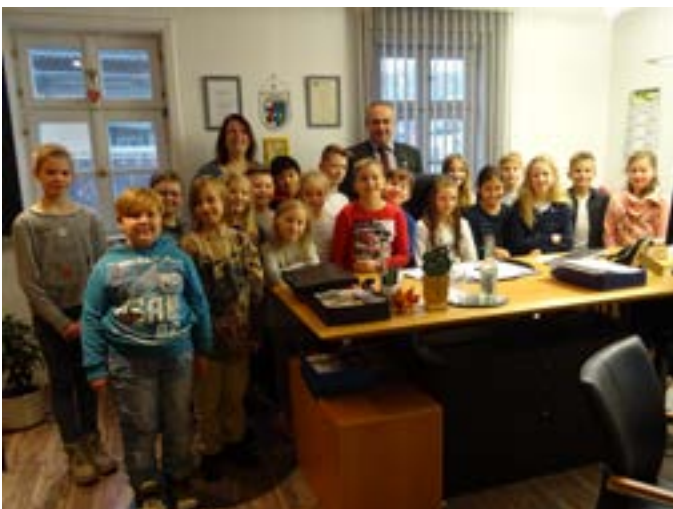
Klasse 4a im Rathaus