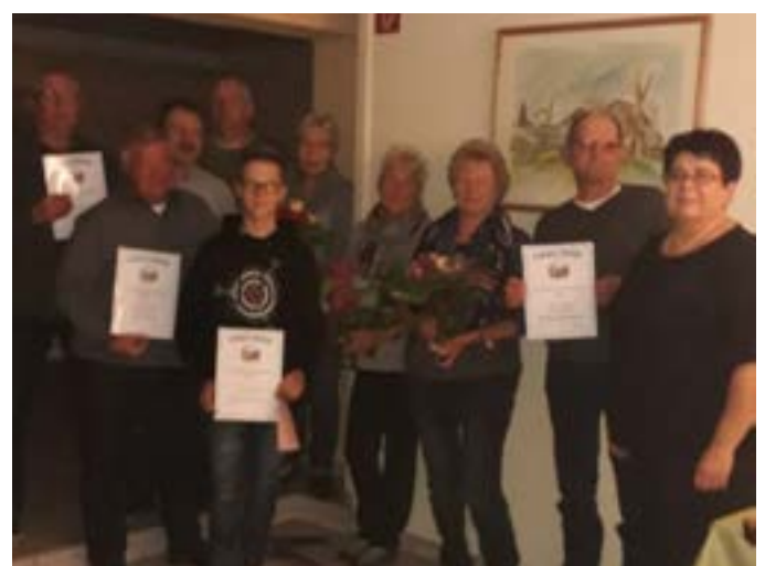
Vereinsmeister des R. V. Viktoria Maineck