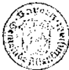
Robert Hümmel Erster Bürgermeister