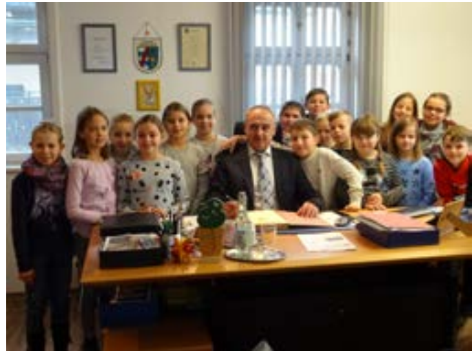
Klasse 4b im Rathaus