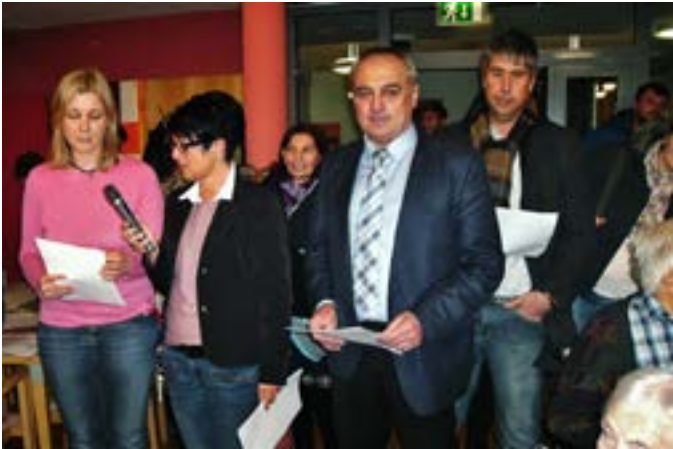
7. Adventsbasar am Seniorenzentrum