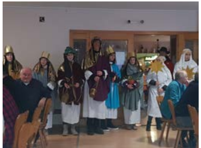
Sternsinger im Sportheim Woffendorf