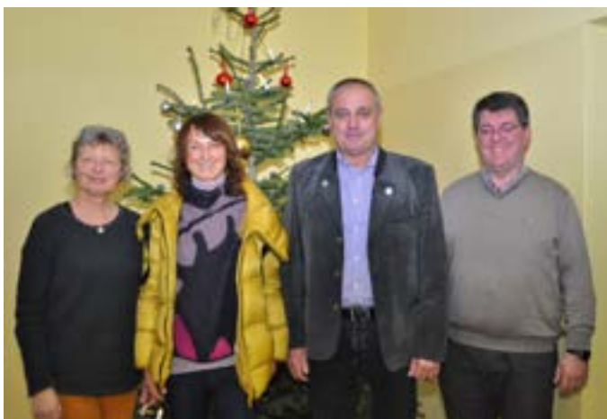
Die drei Kommunen Altenkunstadt, Burgkunstadt und Weismain spenden für die Tafel Burgkunstadt