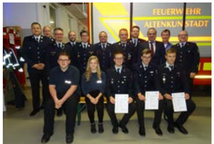
Jahreshauptversammlung FFW Altenkunstadt