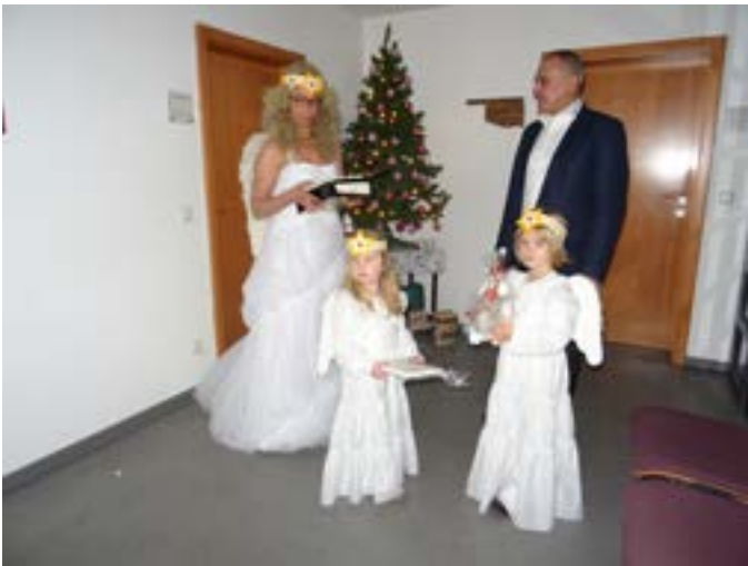
Besuch des Christkinds mit Engelchen im Rathaus