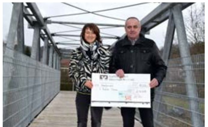
Kommunale Zusammenarbeit - Zuschuss der Gemeinde Altenkunstadt für den Neubau der Brücke über den Main bei Theisau an die Stadt Burgkunstadt