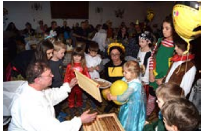
Kinderfasching in Baiersdorf