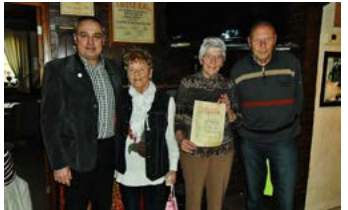
Jahreshauptversammlung mit Ehrungen Seniorenclub 72