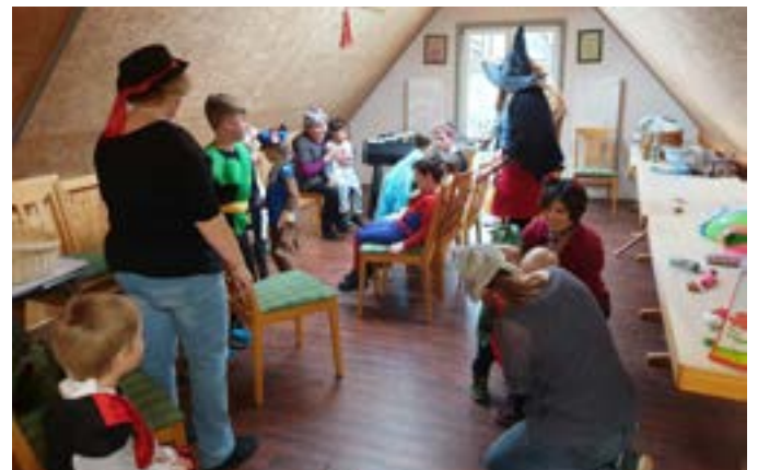
Kinderfasching in Pfaffendorf