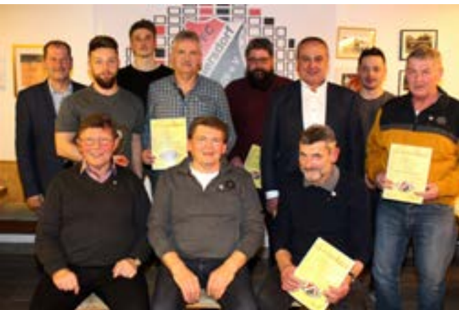
Jahreshauptversammlung mit Ehrungen und Neuwahlen 1. FC Baiersdorf