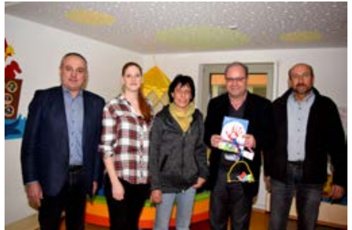
Spendenübergabe der Planungsgruppe Strunz Bamberg je 500 Euro an Kreuzberg-Kita und Kathi-Baur-Kita