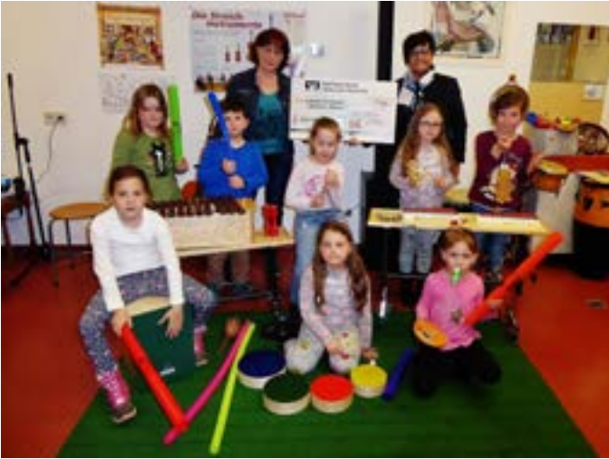
Raiffeisenbank Obermain Nord eG spendet 1600 Euro für die „Musikalische Früherziehung“ der Musikschule