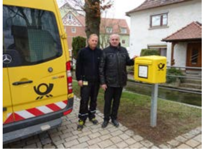
Neuer Briefkasten bei Neumühle