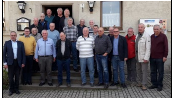
Treffen der ehrenamtlichen Feldgeschworenen, Wanderwegpfleger, Busfahrer und der Rentnertrupp Strössendorf