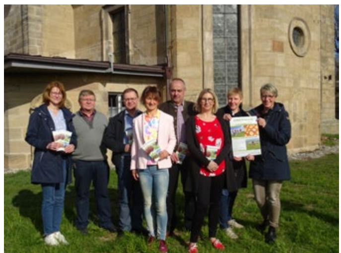
Obermain erleben - Neue Broschüre 2019