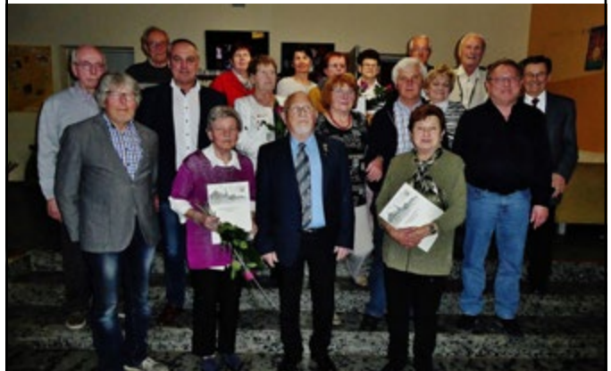
Jahreshauptversammlung mit Ehrungen bei der Singgemeinschaft Altenkunstadt