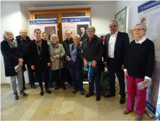
Besuch der Ausstellung „Jüdische Führerscheine“ von Gruppe „In der Heimat wohnen“