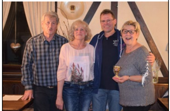
Schnauzturnier 1. FCN Fanclub Altenkunstadt

AM KREISVERKEHR ALTENKUNSTADT TEL. 0 95 72 / 386 36 36