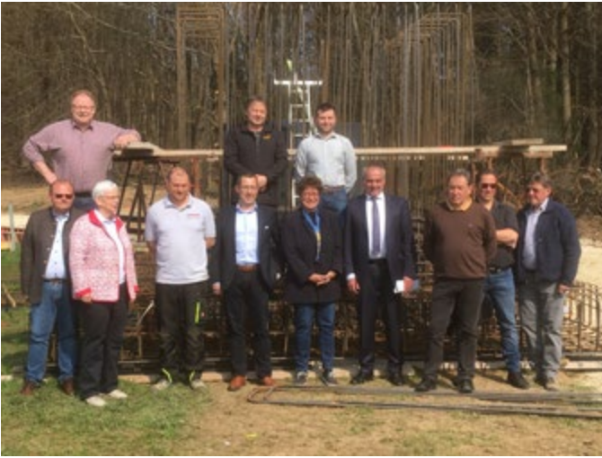
Baubeginn neuer Mobilfunkmast am Gemeindeberg