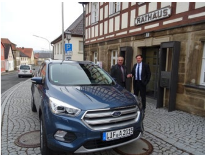
Neuer Dienstwagen für den Bürgermeister vom Hommert Auto Zentrum GmbH