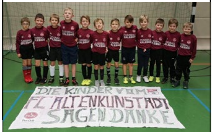
Ein besonderes Erlebnis für die Nachwuchskicker – Die F-Jugend des 1. FC Altenkunstadt waren die Einlaufkinder beim Heimspiel des 1. FC Nürnberg gegen Hertha BSC Berlin