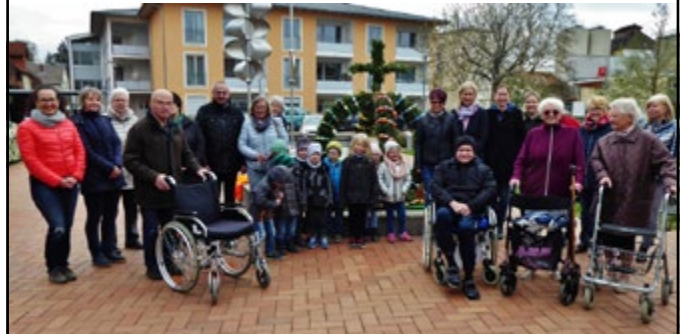
Die Montagsbastler der evang. Kirchengemeinde und Kinder von der Kreuzberg-Kindertagesstätte gestalten den Osterbrunnen am Seniorenheim