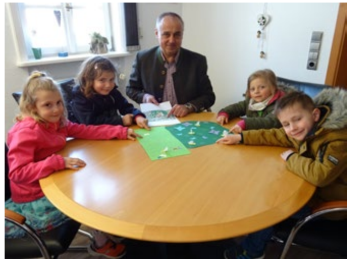
Kinder der Kathi-Baur-Kita stellen beim Bürgermeister einen Antrag auf Anlegen einer Blumenwiese