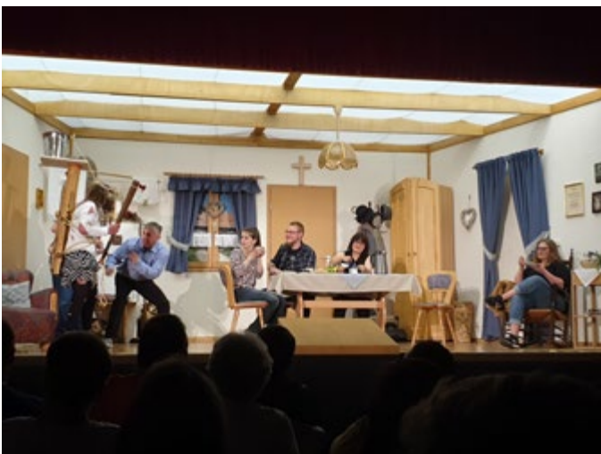
Theater RV Concordia