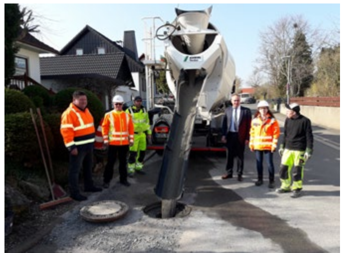
Verfüllung der Keller in Prügel