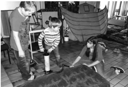
Kinder-Kirchen-Nacht der evang. Kirchengemeinde