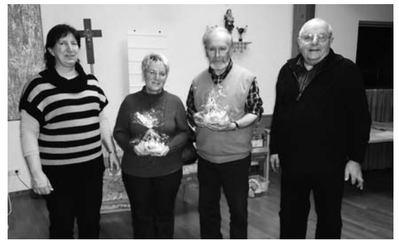
Vortragsreihe im Seniorenzentrum St. Kunigund