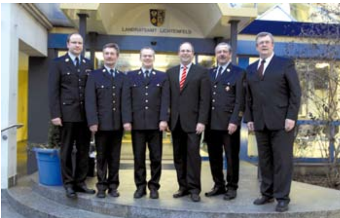
Die Führungskräfte unserer Altenkunstadter Feuerwehr auf Landkreisebene