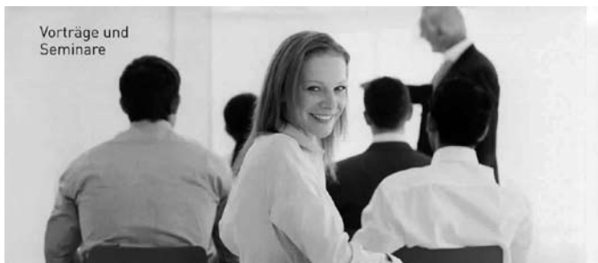
Vorträge und Seminare