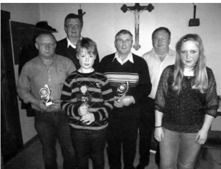
Ehrung der Vereinsmeister Geflügelzuchtverein