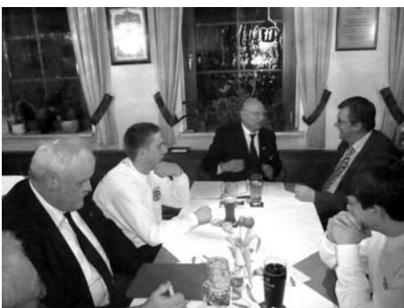
Jahreshauptversammlung Wasserwacht Ortsgruppe Altenkunstadt