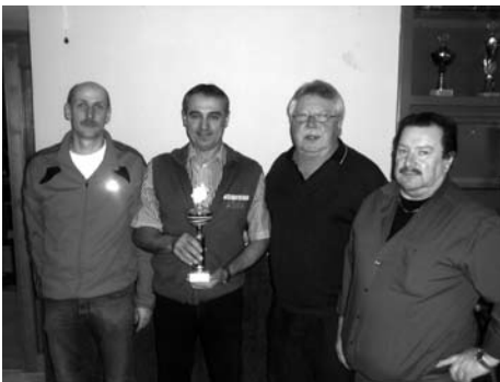
Preisschafkopf des 1. FC Woffendorf