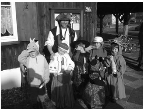
Kinderfaschingsumzug in Prügel