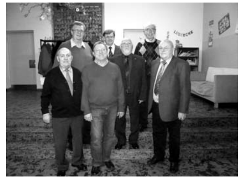
Hauptversammlung mit Neuwahlen bei der Singgemeinschaft Altenkunstadt