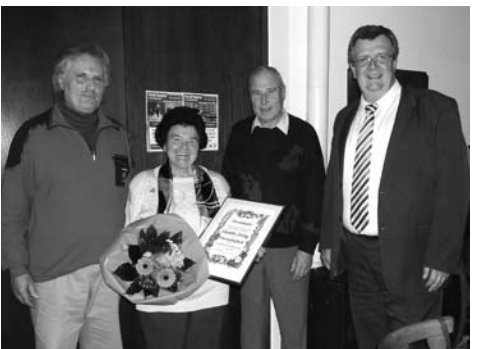
Hauptversammlung mit Ehrungen beim Gartenhobbyverein Altenkunstadt