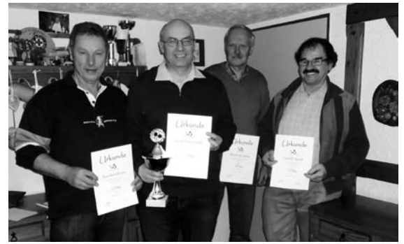
Trimm-Dich-Club Woffendorf Tischtennismeisterschaft