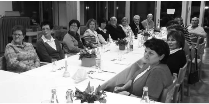
Helfer Dankabend im Seniorenzentrum