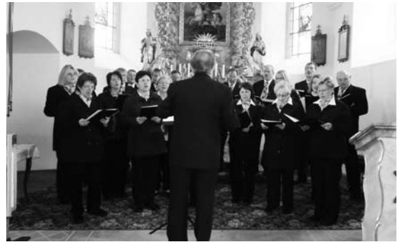
Konzert des Gesangvereins Obersdorf in der Pfaffendorfer Kirche