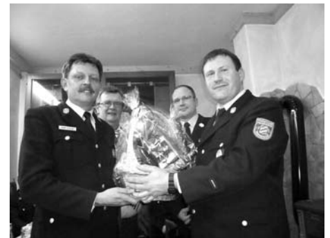
Hauptversammlung der FF Pfaffendorf mit Neuwahlen und Ehrungen