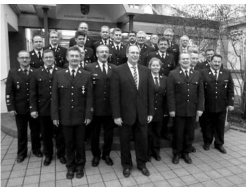
Die neuen Führungskräfte der Feuerwehr im Land- kreis Lichtenfels