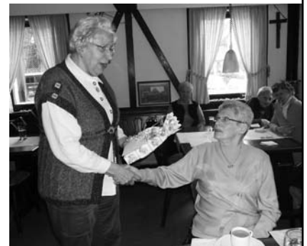
Hauptversammlung Seniorenclub 72