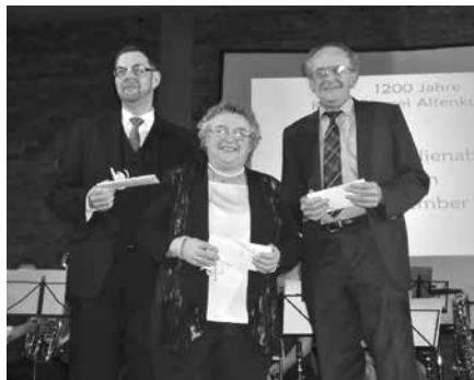
Organisatoren der 1200-Jahrfeier