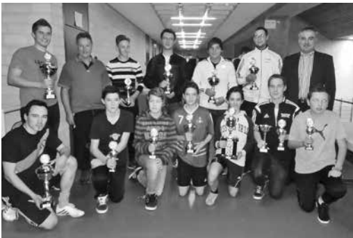
25. Fußball-Tennis-Turnier Trimm-Dich-Club Woffendorf