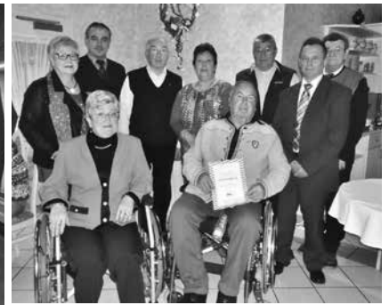
Ehrungen für 10, 25 und 50 Jahre VdK Ortsverband Altenkunstadt