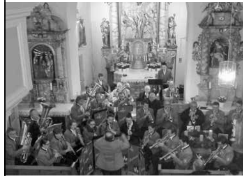
Konzert des Musikvereins Burgkunstadt in der Kuratiekirche Maineck