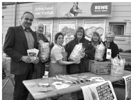
Info-Stand der Burgkunstadter Tafel