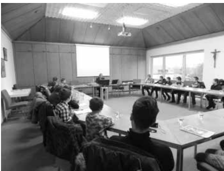
Besuch der Grundschulklasse 4b im Rathaus