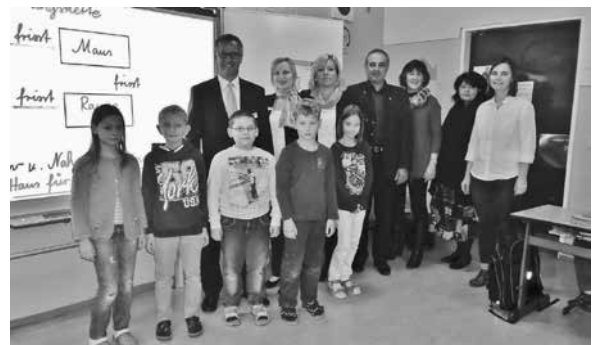
Spende der Raiffeisenbank Obermain Nord eG für Whiteboard Grundschule