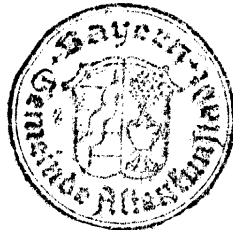
Robert Hümmel Erster Bürgermeister