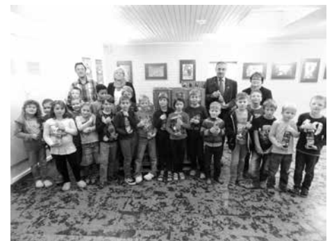
Apfelsaftaktion der Raiffeisenbank Obermain Nord eG gemeinsam mit der Grundschule Altenkunstadt