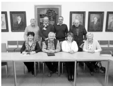
Jahreshauptversammlung Kulturverein Altenkunstadt