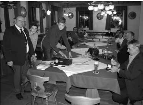
Jahreshauptversammlung Wasserwacht OV Altenkunstadt