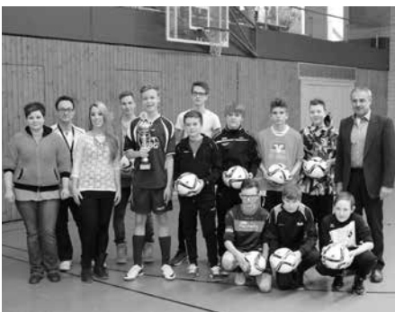
C-Jugendturnier FC Altenkunstadt/FC Woffendorf/FC Baiersdorf