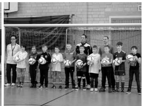
D-Jugendturnier FC Altenkunstadt/FC Woffendorf