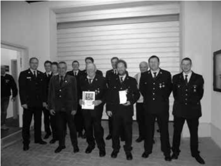
Jahreshauptversammlung mit Ehrungen FFW Pfaffendorf