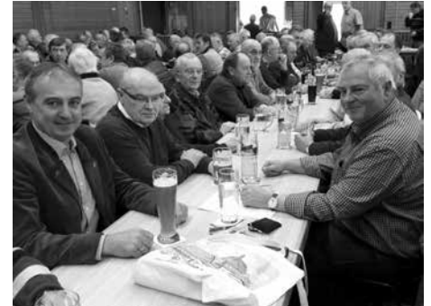
Jahreshauptversammlung Feldgeschworenenvereinigung Coburg-Lichtenfels