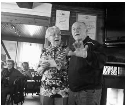
Jahreshauptversammlung Seniorenclub 72