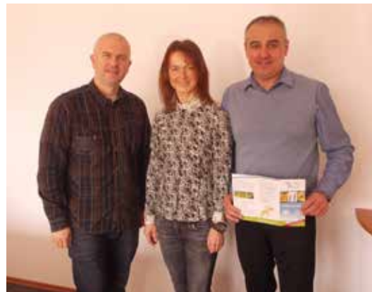
Kommunen gestalten die Energiewende mit Energienutzungsplänen

wird mit einem Fördersatz von 70 % bezuschusst. In Kürze folgt eine ausführliche Information des Stadtrats Burgkunstadt und des Gemeinderats Altenkunstadt in einer gemeinsamen Sitzung.