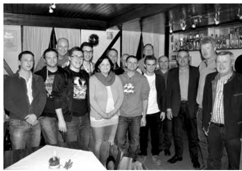
Jahreshauptversammlung des 1. FC Altenkunstadt