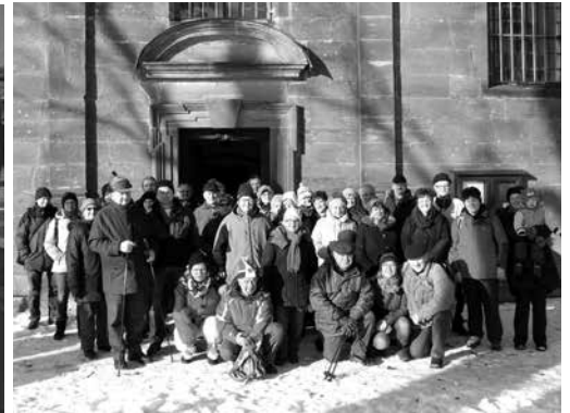
Winterwanderung des Obst- und Gartenbau- vereins Pfaffendorf