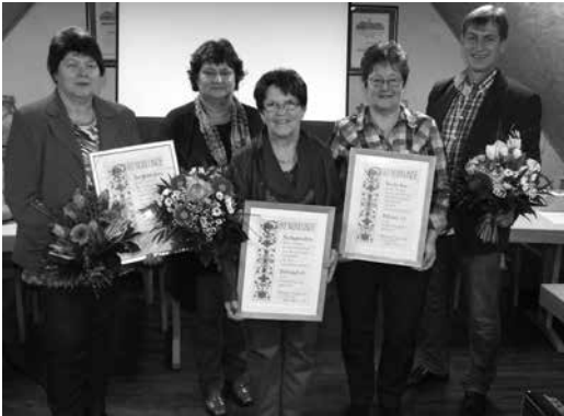
Jahreshauptversammlung mit Ehrungen beim Obst- und Gartenbauverein Pfaffendorf