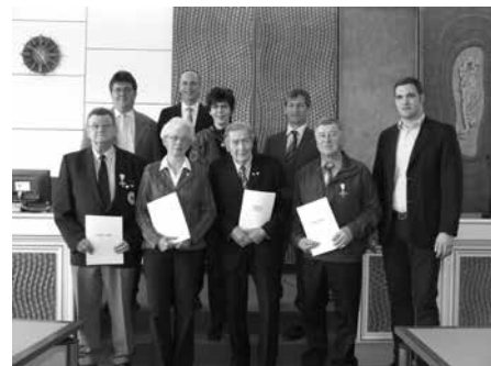
Ehrenzeichen am Bande für langjährige Verdienste beim bayerischen Roten Kreuz und beim Malteser Hilfsdienst