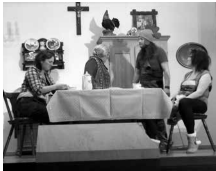
Theateraufführung RV Concordia Altenkunstadt